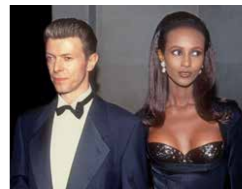
Bij Iman komt hij tot rust: de showman wordt familieman. Het stel in 2002, Bowie in New York in 2012 en 1983 en net samen met Iman in 1990.